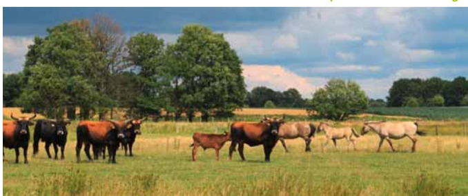
Heckrinder und Konikpferde in der Emsaue Telgte

flussbegleitende Dünen, Röhrichte und Feuchtflächen. Um die fast ursprüngliche Naturlandschaft der Emsaue zu erhalten, gilt für die Ems im Münsterland eine Befahrensregelung für Wassersportler.